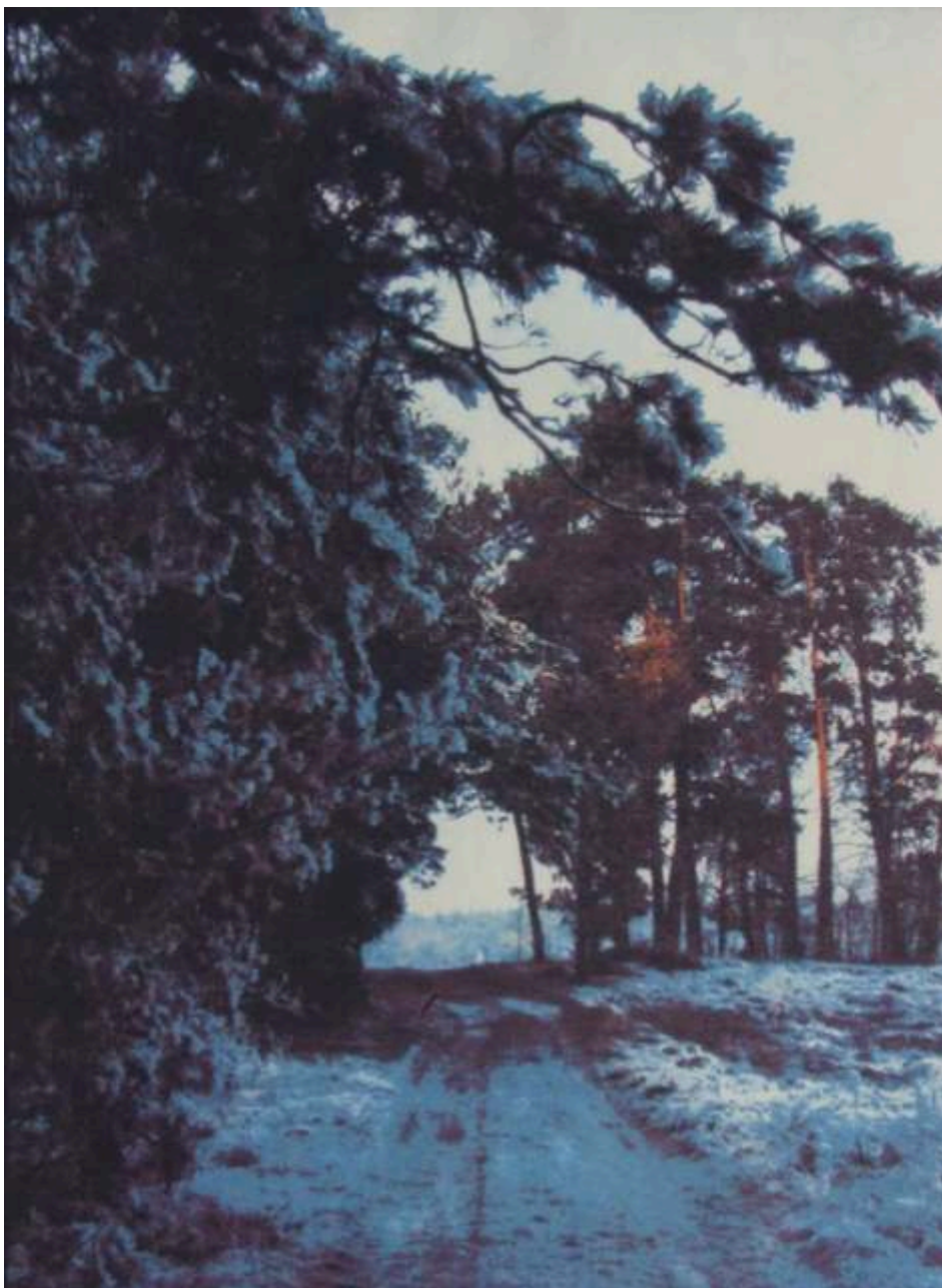
Zimowa droga guma, 22x31, 2008