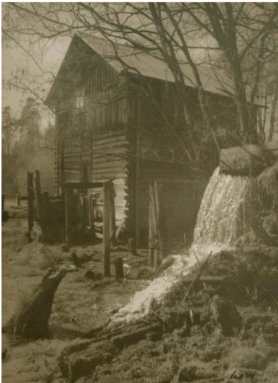
Młyn w Sułcu guma, 24x32, 2008